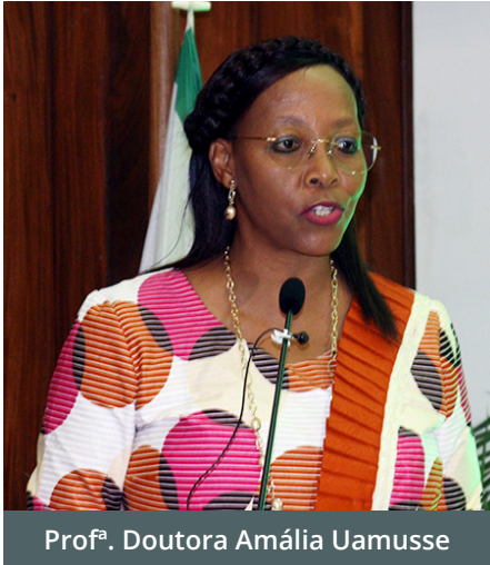
Prof.ª. Doutora Amália Uamusse

em instituições como a Escola de Comunicação e Artes da UEM, assola a educação artística no País, propondo, deste modo, a contratação de artistas, principalmente nacionais, com notoriedade e conhecimento para elevar o sector das artes.